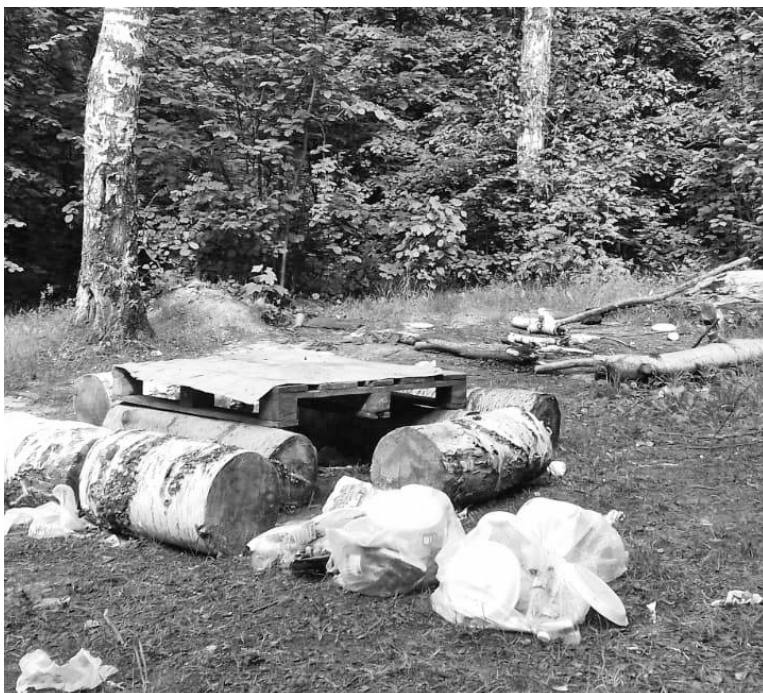
Подобные картинки регулярно появляются в живописном местечке рядом со стадионом «Центральный». Всем им можно дать одно название «После пикника...» А мусорный контейнер - в нескольких десятках шагов.

Трудно поддерживать чистоту и вокруг стадиона. Всё потому, что для одних это красивое место для приятных прогулок, для других же - злачное, где можно «отдохнуть» без ограничений.